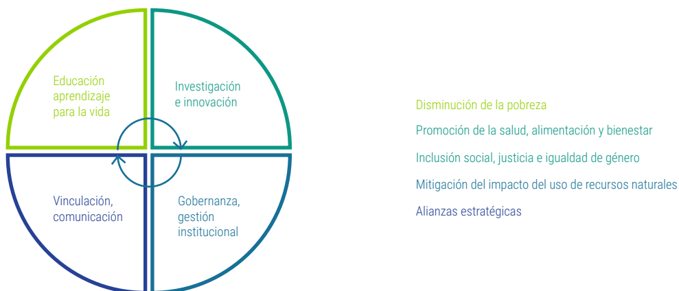
Figura 1 Ámbitos de acción y ejes de sustentabilidad

Una vez que estos elementos se estructuraron, las personas entrevistadas identificaron cuáles eran los programas, proyectos y/o acciones que contribuyen de cierta manera a uno o más ejes en alguno de los ámbitos de acción. Aquellos que fueron mencionados por más de dos personas se resumen en la tabla 1, dando un total de 21. En esta tabla se puede observar la diversidad de opiniones, programas, proyectos y acciones que, en el ideario de las personas entrevistadas, contribuyen o están relacionados con la sustentabilidad en alguna de sus facetas (tabla 1).